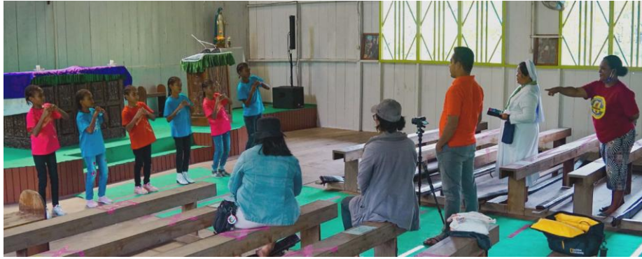
Gambar 1. Suasana produksi video lagu tim KKI Agats-Asmat di Stasi Syuru

Pada tahap distribusi, tim produksi memuat seluruh video lagu dan animasi tersebut ke flashdisk dan dikirimkan ke para pembina di kampung-kampung. Selain itu, seluruh video juga diunggah ke kanal Youtube @omk_indonesia, akun katekese (pengajaran iman Kristen) digital kolaborator Keuskupan Agats-Asmat. Bukan hanya mendapat eksposur dari pengguna internet umum, tujuan diunggahnya video ini untuk memperkenalkan Keuskupan Agats-Asmat yang sebelum 2021 hanya memiliki rekam jejak berupa situs dan Youtube.