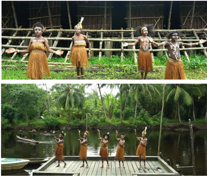
Gambar 2. Cuplikan video lagu rohani SEKAMI Keuskupan Agats-Asmat dengan latar belakang bernuansa Asmat.

Kompilasi 140 video ini disebarluaskan ke seluruh pengajar anak-anak Katolik di Keuskupan Agats-Asmat melalui flashdisk dan unggahan online di Youtube. Media pertama dipilih atas pertimbangan tidak semua kampung di Kabupaten Asmat terhubung dengan jaringan internet. Media kedua dipilih sebagai bentuk pertanggungjawaban dan partisipasi Keuskupan Agats-Asmat dalam pengajaran iman anak melalui media digital yang bisa diakses semua umat Katolik Indonesia. Selain itu, Youtube terbukti sebagai kanal andalan untuk sumber video pembelajaran (Fyfield et al., 2021).