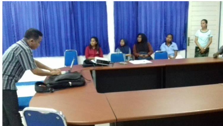
Gambar 3. Kegiatan Workshop untuk Mahasiswa

Peran mahasiswa dalam sistem adalah melakukan pengisian jurnal setiap kali proses perkuliahan dilaksanakan di kelas melalui dashboard mahasiswa. Laporan data jurnal perkuliahan yang diinput oleh mahasiswa dalam sistem bisa langsung dilihat oleh mahasiswa dan pimpinan PT.