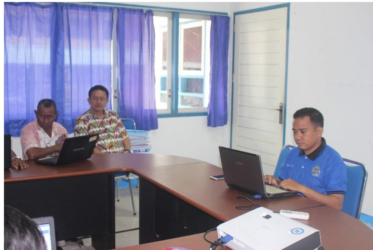
Gambar 1. Kegiatan Workshop untuk Dosen dan Pimpinan PT

Kegiatan workshop untuk dosen dan pimpinan PT pada hari pertama dilaksanakan dengan metode pelatihan penggunaan sistem yang menjadi tugas dan peran pengguna dalam sistem. Peran dosen dalam sistem adalah setiap kegiatan Tri dharma dosen harus dilaporkan dalam sistem melalui dashboard dosen, baik kegiatan pembelajaran, penelitian, dan kegiatan pengabdian kepada masyarakat, setiap dosen diberikan akun untuk melakukan login pada sistem untuk melakukan pelaporan data, selain itu dosen juga bisa melihat aktivitas kegiatannya dalam sistem. Sedangkan peran pimpinan dalam sistem adalah melakukan monitoring kegiatan Tri dharma dalam PT pada semua program studi melalui dashboard pimpinan. Akun untuk login ke dashboard pimpinan diberikan kepada Rektor, Wakil Rektor I, dan juga Lembaga Penjaminan Mutu Internal selaku pengelola sistem. Peran pimpinan dalam sistem juga bisa melihat, memonitoring kegiatan pembelajaran dosen dan mahasiswa di kelas melalui laporan data mahasiswa yang ditugaskan untuk mengisi jurnal perkuliahan dalam sistem, pimpinan bisa juga melihat laporan data kegiatan penelitian dan pengabdian kepada masyarakat untuk dosen.