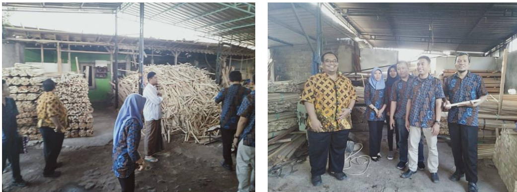
Gambar 2. Meninjau Lokasi Usaha