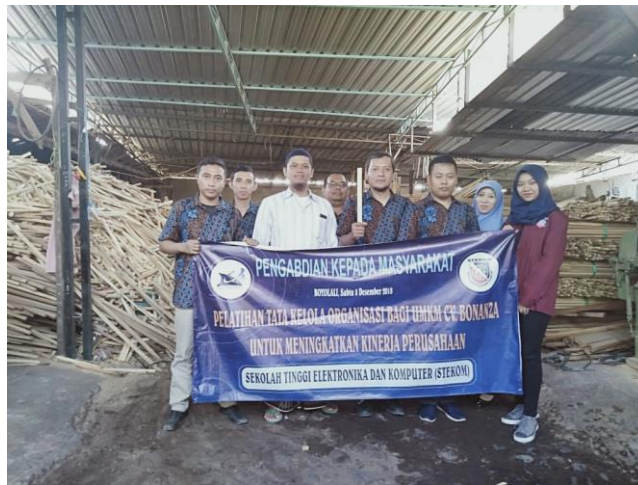
Gambar 4. Penutupan Kegiatan Pelatihan dan Penyuluhan

Hasil dari kegiatan pelatihan dan penyuluhan tata kelola organisasi bagi UMKM CV. Bonanza di Kab. Boyolali, Jawa Tengah dengan beberapa serangkaian kegiatan diantaranya: materi tentang strategi memperoleh pinjaman modal kerja dari perbankan, teknik pembuatan laporan keuangan bagi UMKM, perancangan website pada UMKM, perancangan promotion content pada UMKM, teknik manajemen periklanan, serta perancangan media periklanan. Dengan adanya pelatihan serta