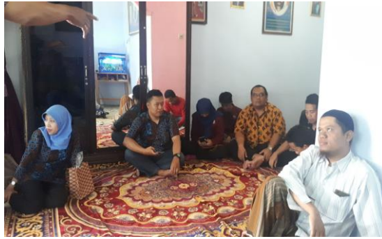
Gambar 1. Penyampaian Materi Tata Kelola Organisasi pada UMKM